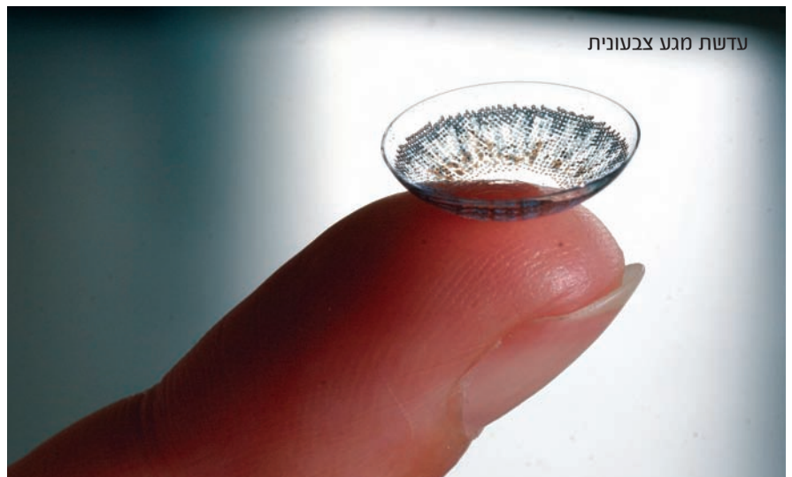
עדשות מגע צבעוניות

מערכת המידע הממוחשבת מאפשרת למנהל החנות להפיק דו"ח המלצה להזמנה, המבוסס על נתוני המכירות בפועל ועל נתוני המלאי על המדף. בצורה זו, מנהל החנות יכול לחדש את המלאי על-פי ניתוח כמותי-עובדתי, ולא על-פי תחושת בטן