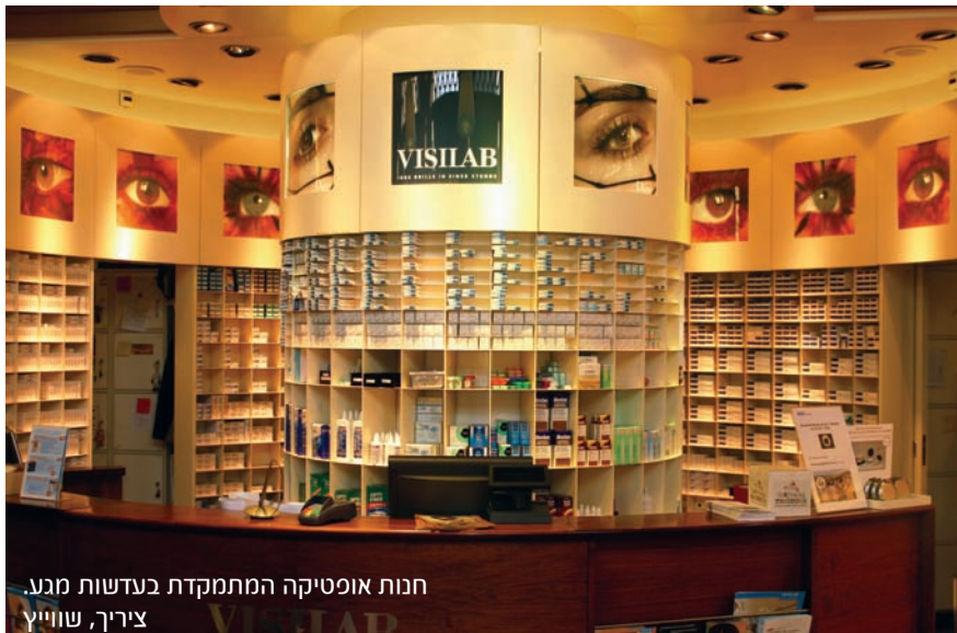
חנות אופטיקה המתמקדת בעדשות מוגע. ציריך, שווייץ

לסיכום, מיגוון המוצרים ההולך וגדל בענף האופטיקה יוצר מורכבות רבה בניהול המלאי בשרשרת האספקה. התנאים החיוניים לניהול אופטימלי של מוצרי האופטיקה הם: ניתוח מוצרי האופטיקה, וסיווגם על-פי מיגוון מוצרים ועל-פי רמת זמינות נדרשת; קביעת מודול נכון לניהול רמות מלאי בשרשרת האספקה, והפעלת מערכות מידע תומכות לניהול הביקושים, המלאי והאספקות. ■