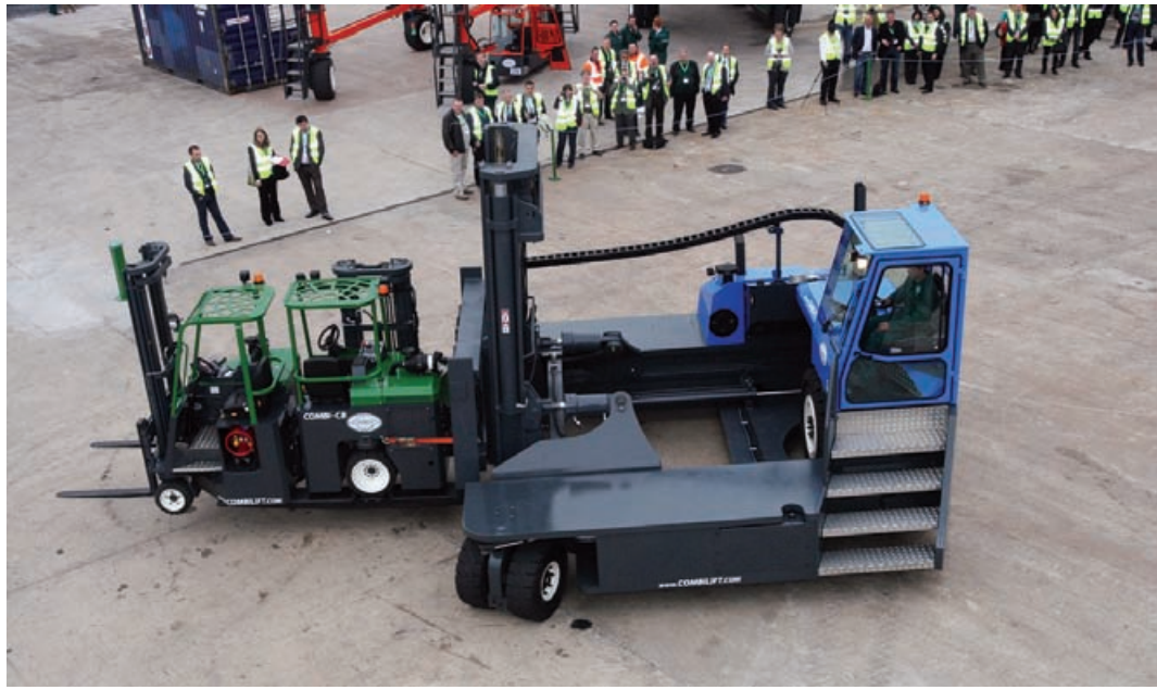
- אירוע ההשקה של Combilift - ראו כתבה בעמוד 24