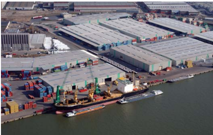
מחסנים בנמל אנטוורפן

האזור הפלמי מייצא סחורות ושירותים בשנה, בערך כולל של כ-175 מיליארד אירו. האזור תורם כ-80% מן התוצר הלאומי הגולמי (תל"ג) של בלגיה, והוא מדורג במקום הראשון בעולם ביצוא לאדם.