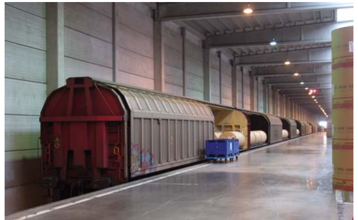
רציף להעמסת רכבת במרלוי"ג של חברת Stora Enso

חקלאיות, קרונות ורכבות. באזור הפלמי ממוקמים ארבעה מפעלים ראשיים של יצרניות הרכב המפורסמות: Opel, General Motors, Ford, Volvo cars ו-Volkswagen, המרכיבים כ-800 אלף מכוניות בשנה. נוסף על יצרניות הרכב לעיל, באזור פועלות החברות: Volvo Europa Truck, Van Hool, VDL, MOL, DAF Trucks, Honda, ועוד. תעשיית הרכב מספקת תעסוקה לגופים הבאים: כ-300 ספקי רכיבים, מפעלי הרכבה, ספקים לוגיסטיים, נמלים, מרכזים טכניים, משרדי תכנון, ארגוני מחקר, מכוני מדעיים, אוניברסיטאות, ועוד.