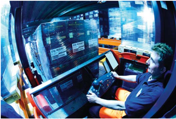
מפעיל מלגת צריח במחסן של ספק השירותים הלוגיסטיים Geodis

מומחיות: האזור הפלמי הוא בעל היסטוריה ארוכה של פעילויות לוגיסטיקה והפצה אל פנים היבשת וממנה אל כל העולם. כוח-העבודה הפלמי מדורג כאחד מכוחות-העבודה היעילים ביותר בעולם, בתפוקה לשעת עבודה. מרבית העובדים הפלמים הם רב-לשוניים (Multilingual), ודוברים את השפות: פלמית, צרפתית, גרמנית ואנגלית.