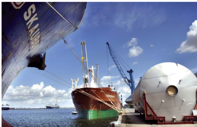
פרויקט מטען (Project Cargo) בנמל אנטוורפן

מסילות הברזל באזור הפלמי הן במקום השני בצפיפותו בעולם. רכבת המטען הבלגית (B-Cargo) מובילה כ-60 מיליון טון מטען בשנה, והיא מציעה טווח רחב של פתרונות תובלה לכל רחבי אירופה. הרכבת הבלגית מציעה פתרונות תובלה "תפורים" על-פי מידותיו של הלקוח - החל בהעמסת המטען ובפריקתו, והמשך באחסונו, הובלתו אל תחנות הרכבת, ומתחנות הרכבת אל יעדי ההפצה הסופיים. המטען המועבר ברכבת נמסר ביעדו הסופי, בו-ביום, ולכל המאוחר ביום המחרת.