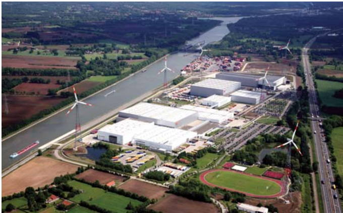
המרכז הלוגיסטי האירופי של חברת נייק (Nike)

מומחיות: האזור הפלמי הוא בעל היסטוריה ארוכה של פעילויות לוגיסטיקה והפצה אל פנים היבשת וממנה אל כל העולם. כוח-העבודה הפלמי מדורג כאחד מכוחות-העבודה היעילים ביותר בעולם, בתפוקה לשעת עבודה. מרבית העובדים הפלמים הם רב-לשוניים (Multilingual), ודוברים את השפות: פלמית, צרפתית, גרמנית ואנגלית.