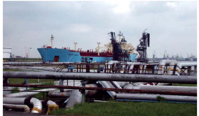
קווי צינורות (Pipeline) בנמל אנטוורפן

• הנמל של אנטוורפן (Antwerp): נמל פנים-ארצי, הנמצא במרחק של 80 ק"מ מן הים הצפוני. הנמל של אנטוורפן הוא השני בגודלו באירופה והחמישי בגודלו בעולם. אזור הנמל הוא המרכז הפטרוכימי (Petrochemical Center) הגדול ביותר באירופה. במהלך שנה, הנמל מטפל בכ-180 מיליון טונות מטען ובכ-8 מיליוני TEU. במהלך השנה, פוקדות את הנמל 15 אלף אוניות ויותר מ-65 אלף דוברות (Barges).