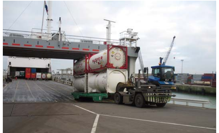
העמסת אוניית Ro/Ro בנמל ז'יברוד

האזור הפלמי מכיל יותר מ-400 מרכזי הפצה אירופיים (Europe Distribution Centers) [להלן - "EDC's"], המשמשים להפצת מיוגון רחב של מוצרים - החל ממזון ומכימיקלים וכלה באלקטרוניקה, בחלקי-חילוף לרכב, ובציוד רפואי. כל ה-EDC's משמשים להפצת סחורה לחמש מדינות אירופיות לפחות, וחלק מהם משמש להפצת סחורה גם למזרח התיכון, לאפריקה ולאזורים אחרים בעולם. כל EDC מכיל שטח אחסון של עשרות אלפי מ"ר (ולעתים, אף יותר מ-100 אלף מ"ר), וכן מיוגון של אמצעי אחסון, אמצעים ממוכנים לביצוע עבודות ערך מוסף, ואמצעי שינוע.